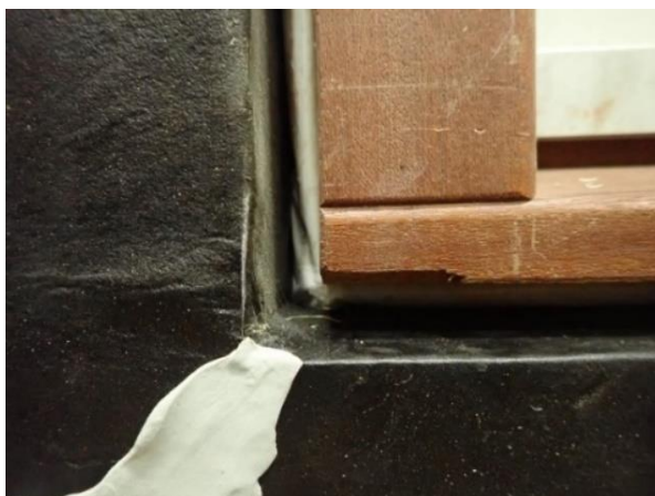
Foto's testelement met Profi Airtight 2.0